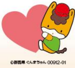
くんまちゃん 00912-01