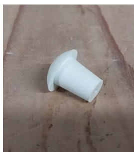
図 5. ゴム鋏