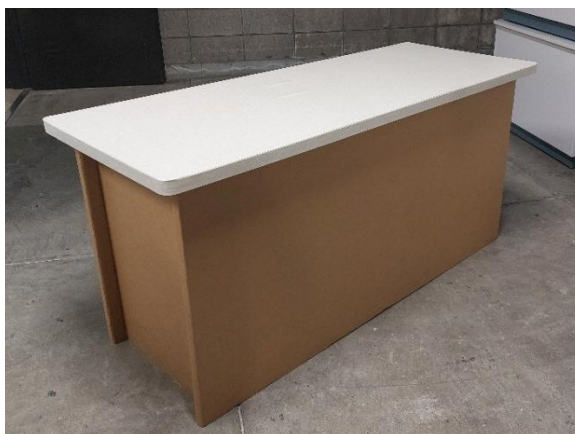
図 1. エ芸台