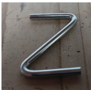
図 4. Z カン