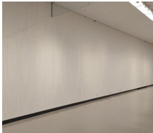
図 2. 鉄板バックパネル